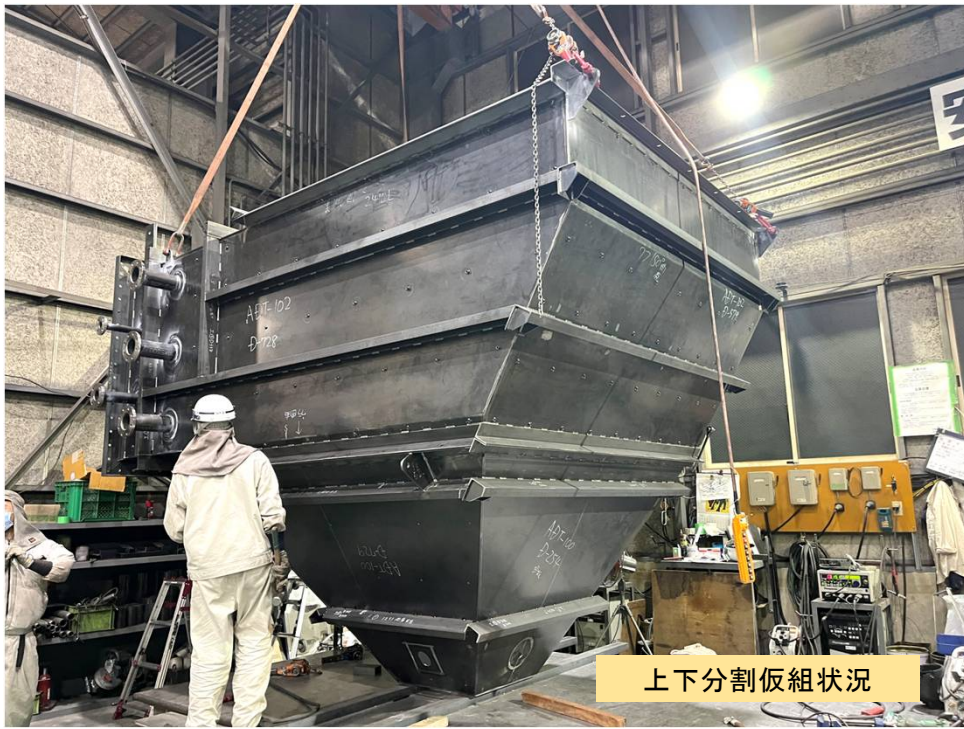
上下分割仮組状況