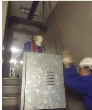
搬入経路 850W × 2,000H