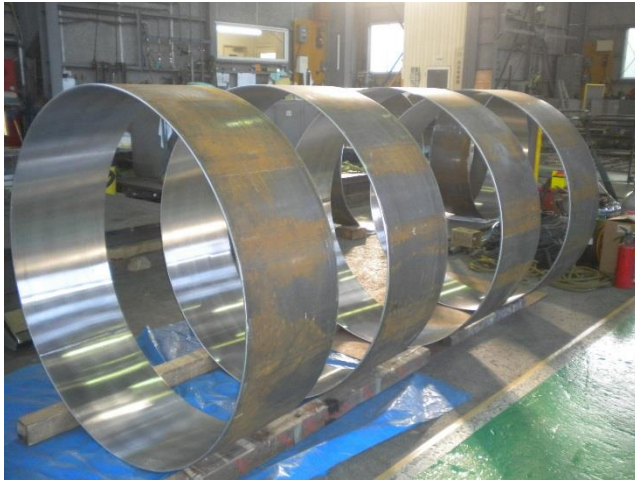
鏡板 胴板 現場搬入可能な形状に加工